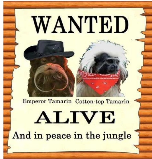
Nouveau design Tamarins