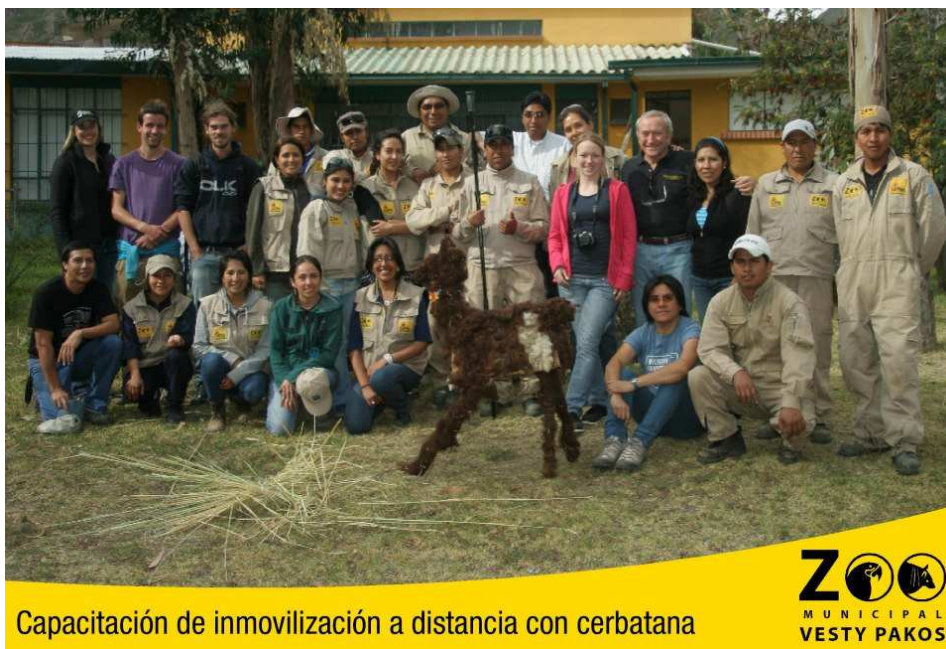
Capacitación de inmovilización a distancia con cerbatana